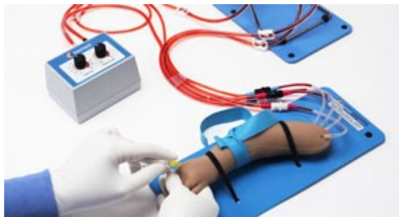
Externí zásobník krve pro nepřetržitý přísun tekutin, natlakování cév a možnost pozorování zpětného tlaku.