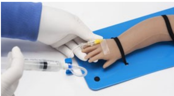
Kubitální a ulnární venózní přístupová místa pro kanylaci, infuzi, bolusovou injekci, odběr krve.