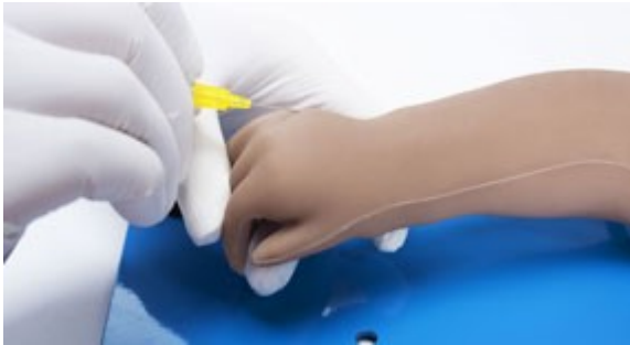
Realistická kůže zaručuje realistický vzhled a pocit při provádění úkonů.