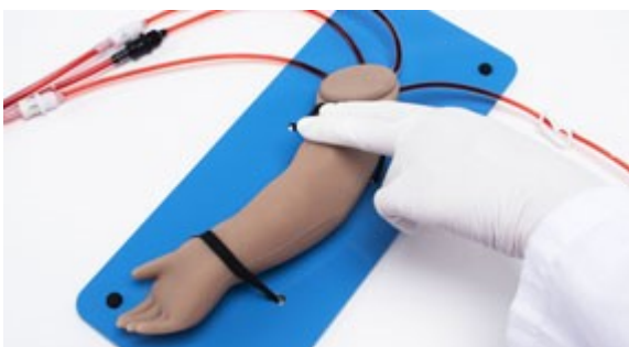
Hmatatelný radiální a brachiální puls.