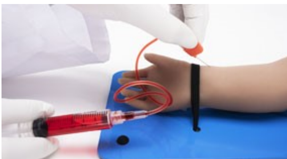
Radiální a brachiální arteriální přístupová místa pro kanylaci a odběr krve.