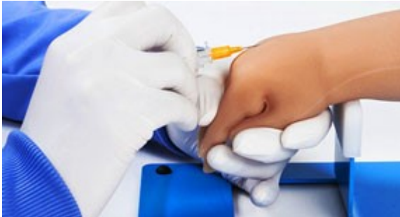
Realistická kůže zaručuje realistický vzhled a pocit při provádění úkonů.