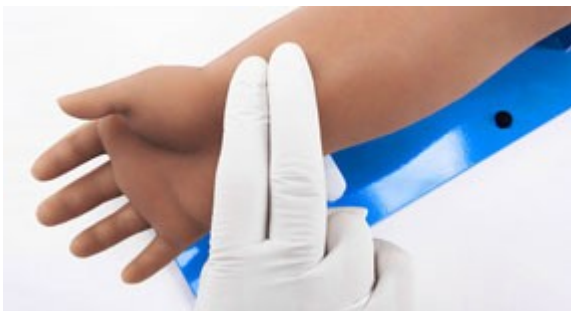
Hmatatelný radiální a brachiální puls.