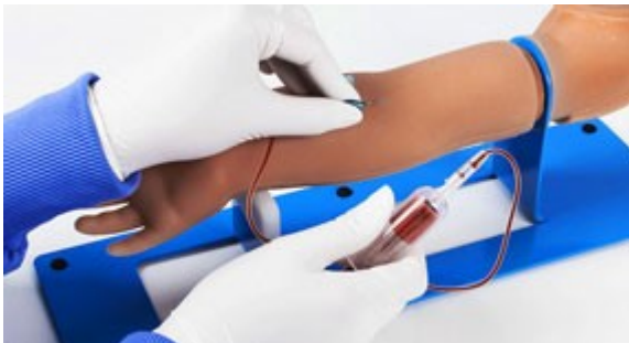
Kubitální a ulnární venózní přístupová místa pro kanylaci, infuzi, bolusovou injekci, odběr krve