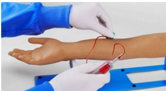
Kubitální a ulnární venózní přístupová místa pro kanylaci, infuzi, bolusovou injekci, odběr krve.