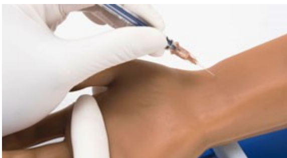
Radiální a brachiální arteriální přístupová místa pro kanylaci a odběr krve