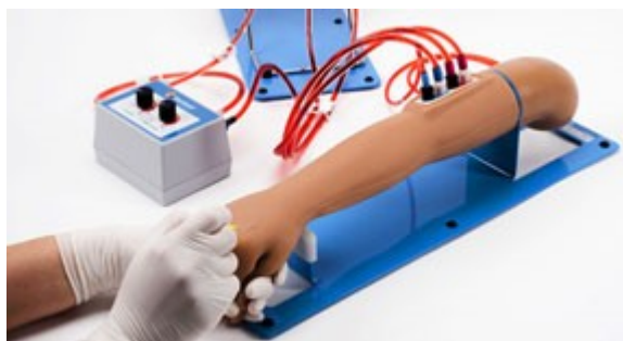
Externí zásobník krve pro nepřetržitý přísun tekutin, natlakování cév a možnost pozorování zpětného tlaku