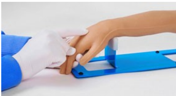
Realistická kůže zaručuje realistický vzhled a pocit při provádění úkonů.