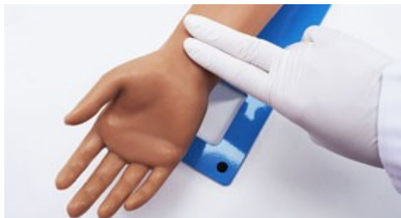
Hmatatelný radiální a brachiální puls.