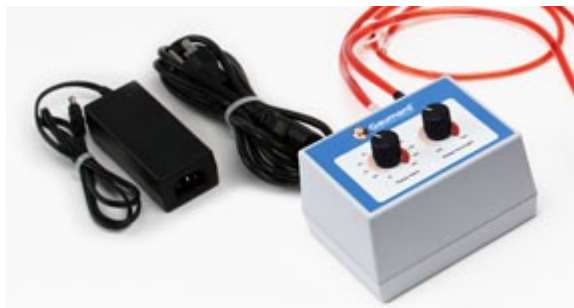
Elektronicky nastavitelná síla a frekvence pulzu (0 - 180 BPM).