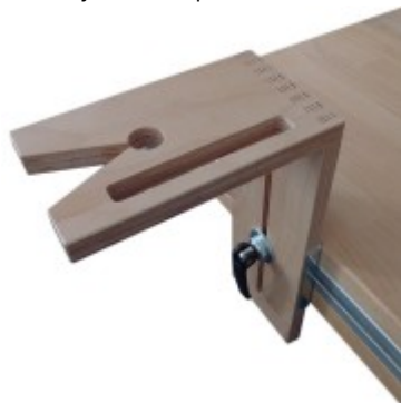
Pro řezání lupínkovou pilou