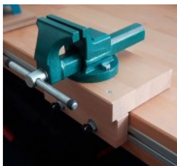
Dílenský svěrák s podložkou