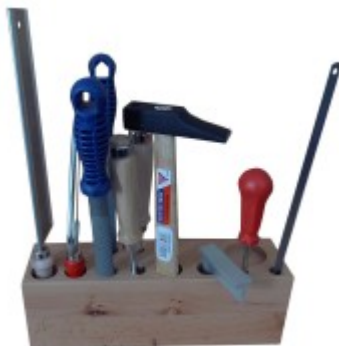
Sada nářadí - dřevo