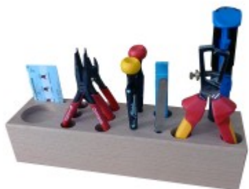
Sada nářadí - elektro