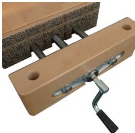
Variogrip vložka - protikus k čelisti