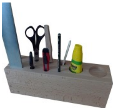
Sada náradí - papír