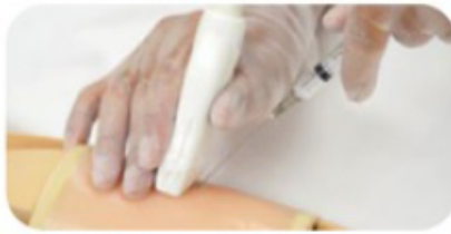
Punkce prováděná pomocí ultrazvuku