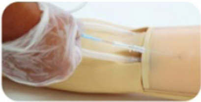
Zavedení vodičícího drátku