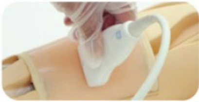
Výběr punkčního místa